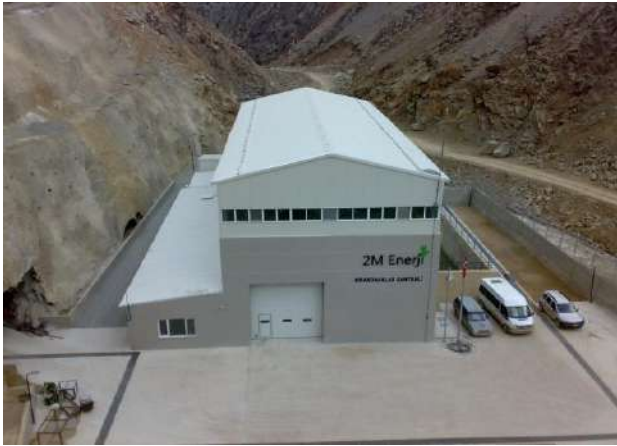
Erzurum İspir/Sırakonaklar HES – 18 MW