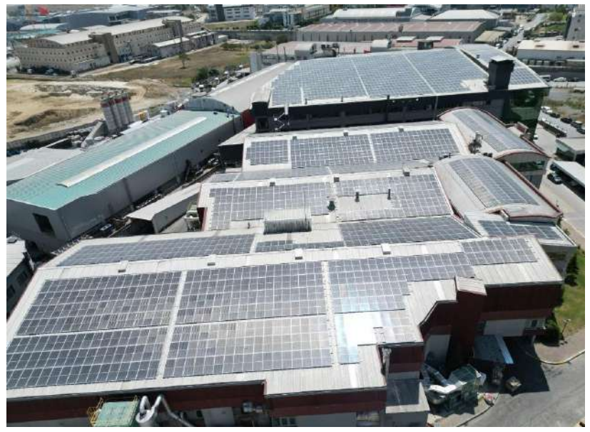
Antil Dantel 1.617 kWp/1.200 kWe